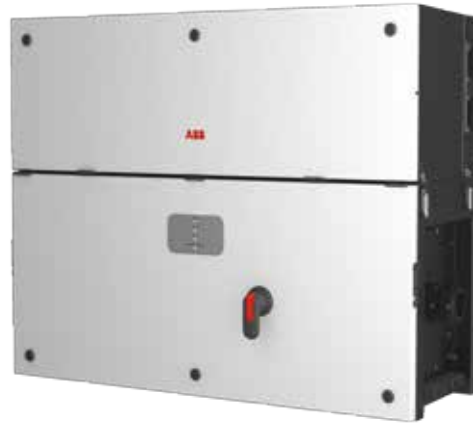
ABB String-Wechselrichter PVS-100/120-TL 100 bis 120 kW